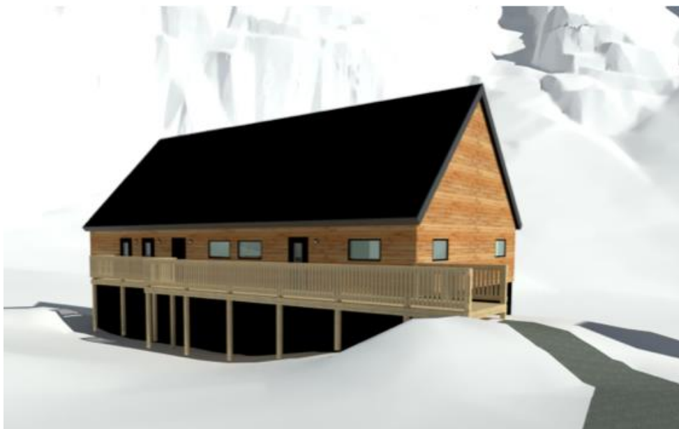
Timersortarfittaassamut/kombihusimut nutaaq napparneqartussamut takussutissiaq (takutitassiaq Titarneq Aps-imit suliaavoq) | Visualisering af det nye kombihus (visualiseringen er udarbejdet af Titarneq Aps)