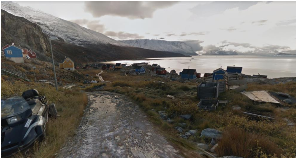
Kujammut isikkivik piffiup C01-ip qeqqa tungaaniit | Kig mod syd fra midten af delområdet C01.