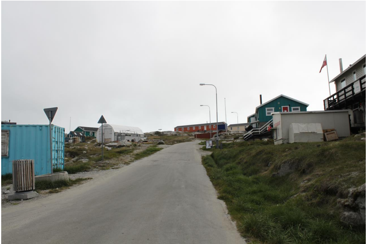
Sumiiffik aqquuserneqassaaq Sermermiut aqputaanit sumiiffik akulloqqullugu | Området vejbetjenes fra Sermermiut aqputaa som fører gennem delområdet