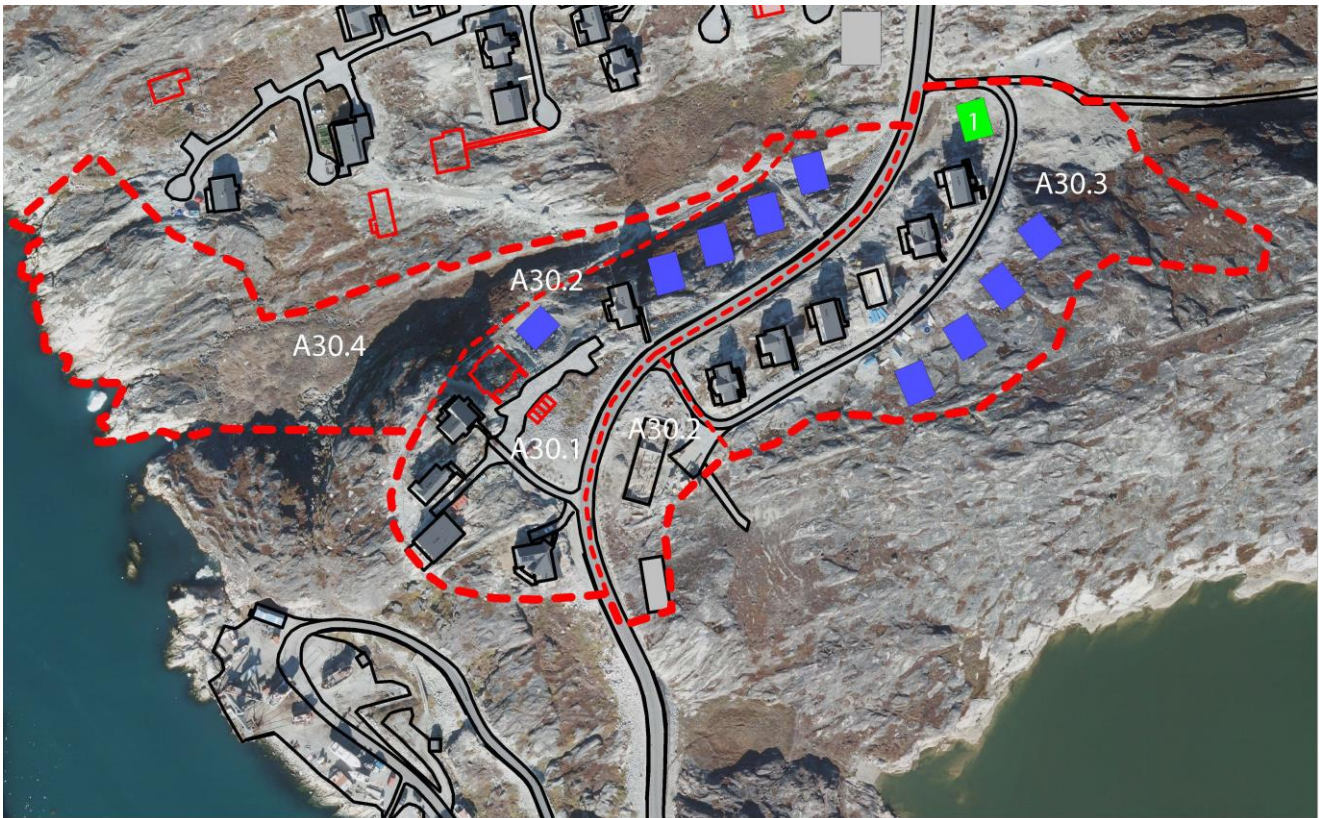
Pissutsit pioresut killiliussallu | Eksisterende forhold og afgrænsning