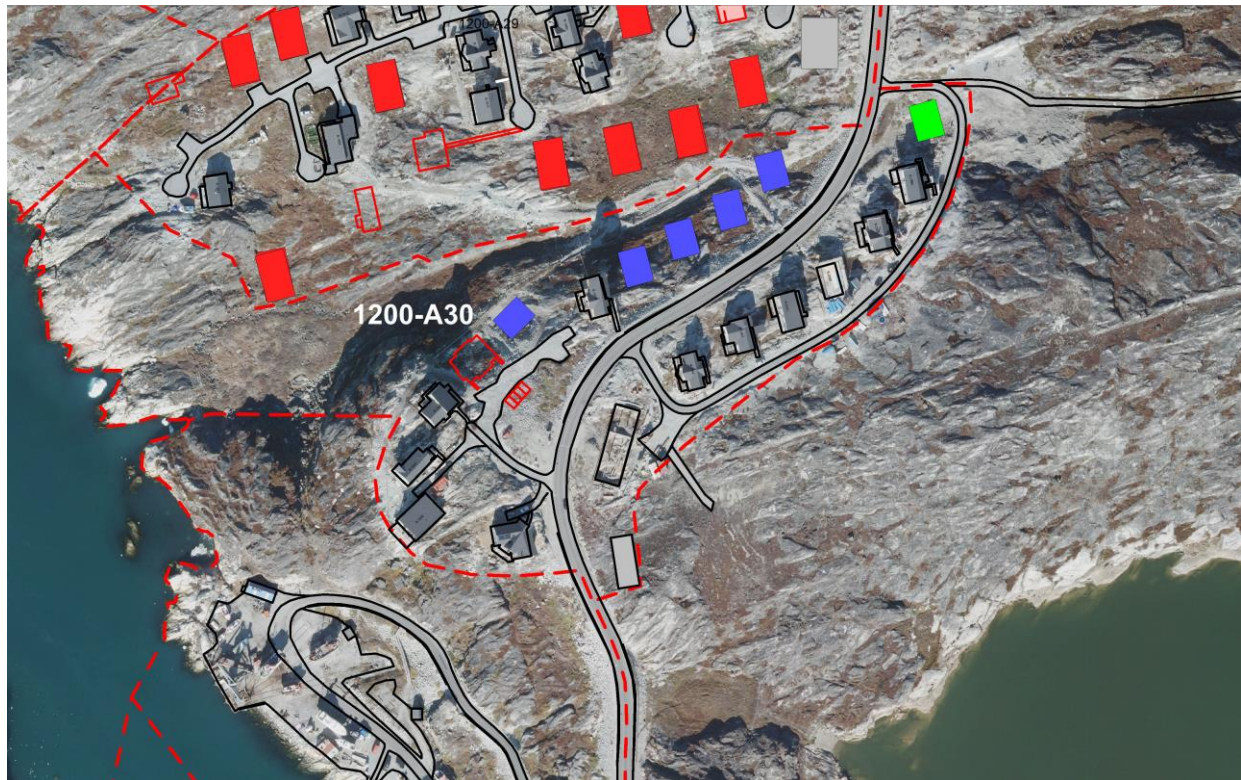
Siornatigut | Før

Qaasuitsup Kommuneplan 2014-26 Kommunepilantillæg nr. 73 er ikke i overens- stemmelse med de overordnede bestemmelser i Kommuneplan 2014-2026 for Avannaata Kommunia, hvor delområdet er udlagt dels til boligformål og rekreativt område.